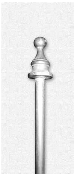
Vârful de vergea.